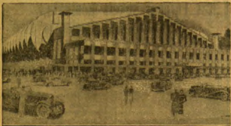
Čia matomas didžiausio Anglijoje sporto stadiono projektas. Šis stadionas bus pastatytas Vembly (Londono priemiesty) ir jame sutilps visos sporto šakos.