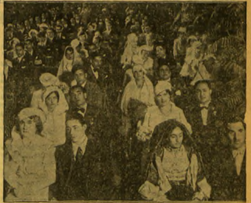
Mūsų paveiksle matome masinių vestuvių dalyvius Italijoje. Šios vestuvės įvyko spalio m. 30 d. Romoje. Visoje Italijoje tą dieną sujungta 60.000 porų. Vienoje Romoje sujungta 2.600 porų.