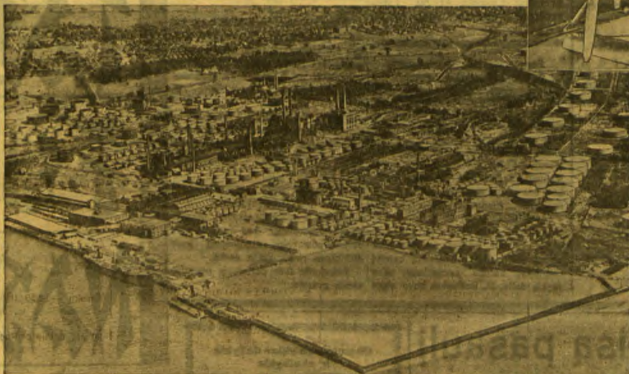
Waukešoro rafinerija, didžiausi ir naujausi visų mūsų keturių rafinerijų Amerikoje, turi 800 tepalo tankų. Didesniame tanke 80.000 statinių. Sulyginimui galime pažymėti, jog tepalų pareikavimas trijose Pabaltijo valstybėse sudaro apie 40.000 statinių.