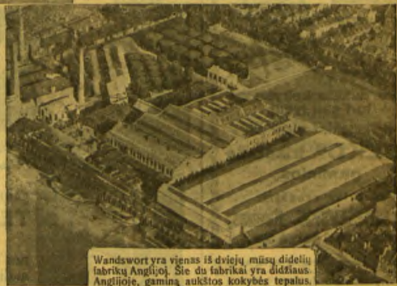
Wandswort yra vienas iš dviejų mūsų didelių fabriku Anglijoje. Šie du fabrikai yra didžiausi Anglijoje, gamina aukštos kokybės tepalus.

Tokios pat reikšmės, kokios Gargoyle Mobiloil turi motorų pasaulyje, kiti mūsų aukštos kokybės tepalai turi pramonėje ir garlaivinkystėje. Tepimas Gargoyle aukštos kokybės tepalais turi sekančias pirmenybes: