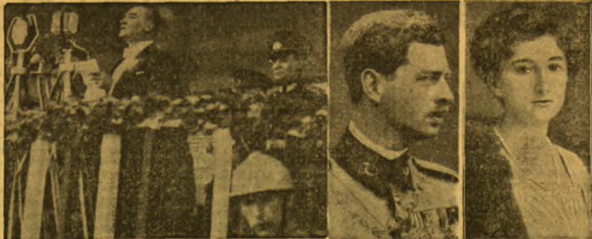
Mūsų paveiksle matome šneka nt i mikrofoną Turkijos prezidentą Mustafą Kemal Pašą 10 metų turkų respublikos isikūrimo proga.

Po dviejų metų buvimo šiaurinėje Kinijoje į Tokio grįžta japonų kariuomenės dalys pasilsėti. Mūsų paveiksle matome japonų grįžtančius kareivius Tokio geležinkelio stoty.