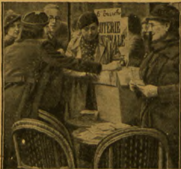
Prancūzų moterys tebekovoja už rinkimų teises. Rinkimų ir savivaldybes metu prancūzų moterys protestuodamos irgi „balsavo“, kad joms būtų leista balsuoti.