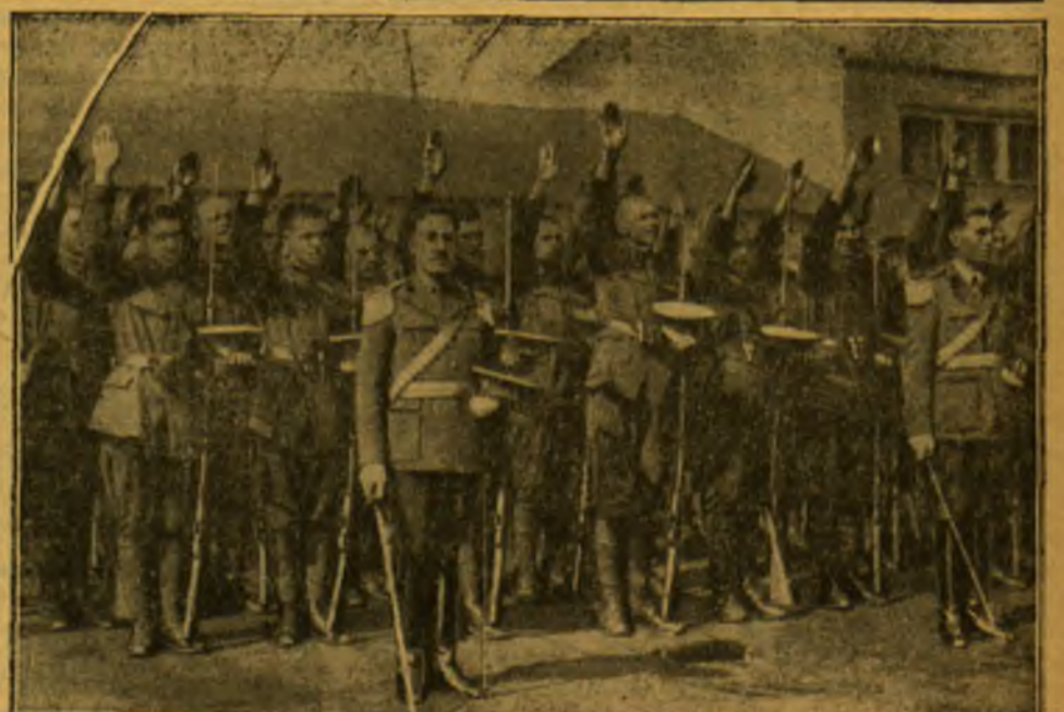
Kairė: Amerikos šokikės Kalifornijoje, Palm Byčo kurorte, šoka naują šoki apsiirengusios Havajų moterų aprėdalais, Havajų gitarai griežiant ir indėnu būgnui pritarant. Šis šokis būsiąs vietoj rumbos. Dešinė: Šitai padirbinami rumunų kariuomenės naujokai, paimti 1935 metais.