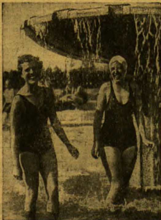
Kairėje: Anglijoje, Kento grafystėje įvykusi geležinkelio katastrofa dėl ležmininko neapdairumo. Dešinėje: Dvi undinės.