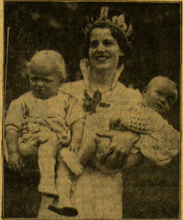
Du gražiausi ir sveikiausi angliukai Londone premijuoti.