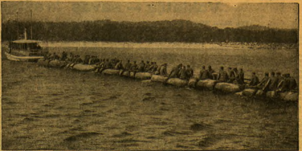
Kairėje: Vokietijos karo ministeris fon Blombergas Budapešte važiuoja drauge su vengrų karo ministru gen. Kederiu. Dešinėje: Vokiečiai daro desanto bandymus. Pūstiais gumos laivais labai esą lengva iš laivo į krantą išsodinti gerai ginkluotą kariuomenę.

Du vaizdai iš tarptautinių prekybos rūmų atidarymo Berlyne, per kurį vokiečiai vėl reikalavo kolonijų. Apačioj matyti Geringa atidarant kongresą. Dešinėje garbės tribūna kongrese.