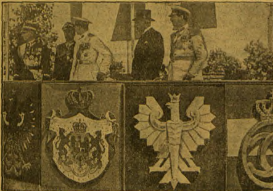
Kalrėje: Rumunijos karalius Karolis su sosto įpėdiniu Mykolu Varšuvoje, vyriausybės tribunoje greta prezidento Moscickio ir maršalo Rydz-Smiglo priima kariuomenės parada. Dešinėje: Vokiečių povandeninis laivas „U 28“ išplaukia iš Lisabonos uosto į Ispanijos vandenį.