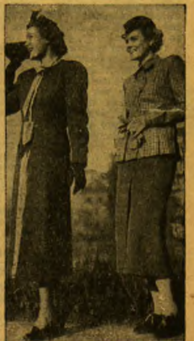
Madingi vasariniai apdarai.