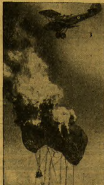
Iš Anglijos aviacijos dienos. Lėktuvas sunaikina per manevrus balioną.